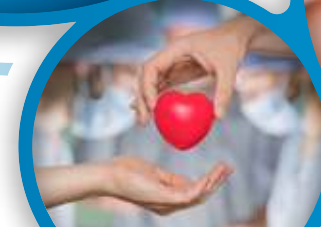
Transfert de l'organe