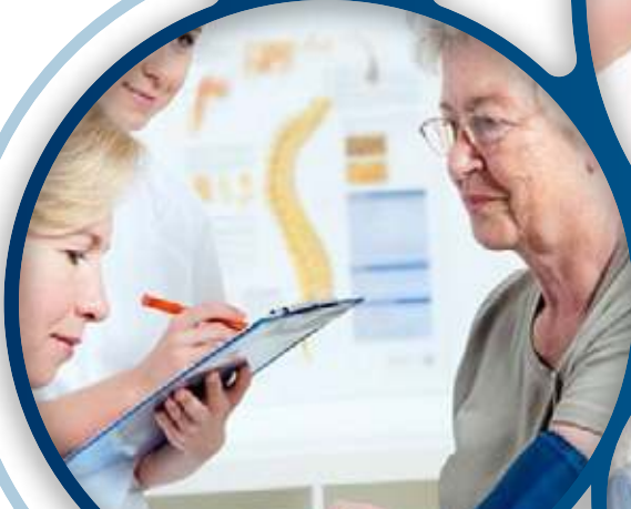
Soin des vieux et handicapés