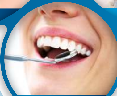
Traitements de dent