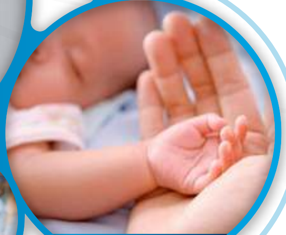
Fertilisation in vitro