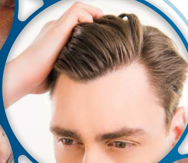
Transplantation des cheveux