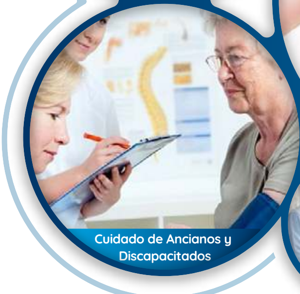
Cuidado de Ancianos y Discapacitados