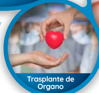
Trasplante de Organos