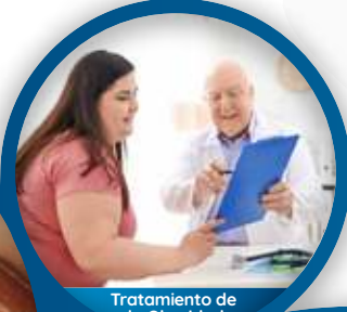
Tratamiento de la Obesidad