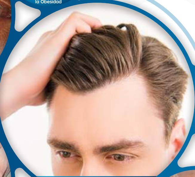
Transplante de Cabello