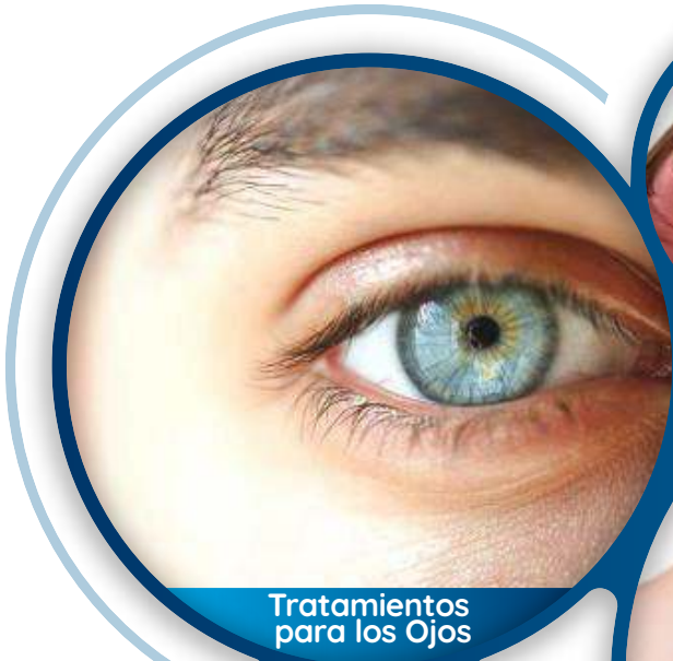
Tratamientos para los Ojos